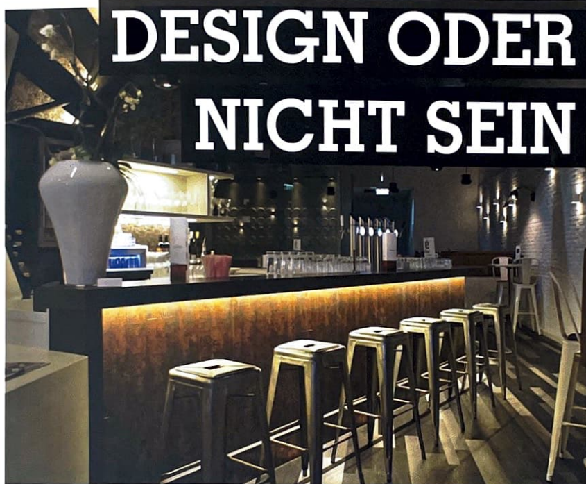
Perfekt umgesetzt. Gastrodesign und Inneneinrichtung by SUPASTUDIO

SUPASTUDIO bringt neue Gastro-Ideen auf den Punkt: