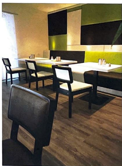
Projekt Hotel Amalienburg in München